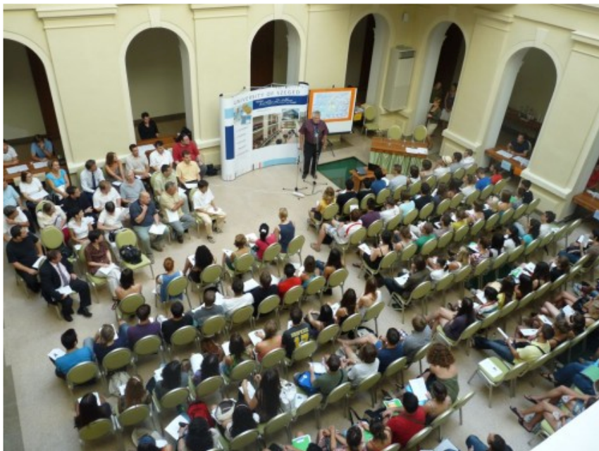
Köszöntötte az Erasmusosokat a rektor.

Az elmúlt pár napban úgynevezett orientációs héten vettek részt a külföldi hallgatók, ahol megismerkedhetnek a várossal, a Szegedi Tudományegyetemmel, annak életével, beiratkoztak az őket fogadó karokra, találkozhattak a többi országból érkezett külföldi diákokkal és az itteni életüket segítő magyar egyetemistákkal csakúgy, mint a tanszéki koordinátorokkal. Az EHÖK Külügyi Bizottságának mentorai segítik őket itt tartózkodásuk alatt, velük közösen kerestek a héten albérlést is. Sőt, ma estére már bulit is szerveztek nekik.